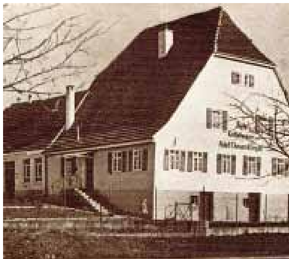
1923 - Wohnhaus mit Fertigung