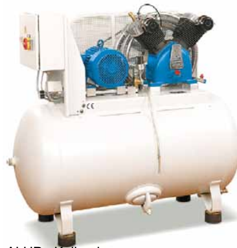
ALUP - Kolbenkompressor