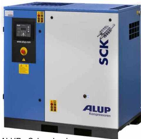
ALUP - Schraubenkompressor