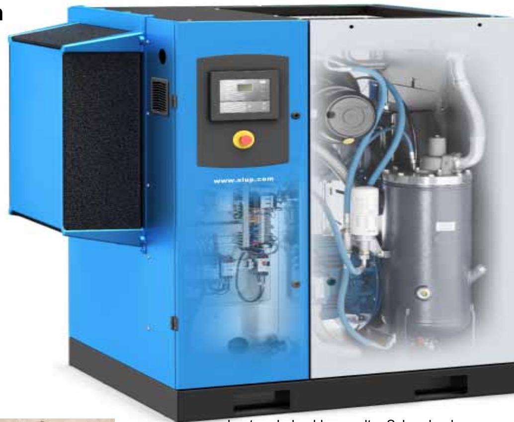
heute - drehzahl geregelter Schraubenkompressor

Die ALUP Produkte garantieren einen ökonomischen und ökologischen Betrieb der Kompressoranlage beim Kunden.